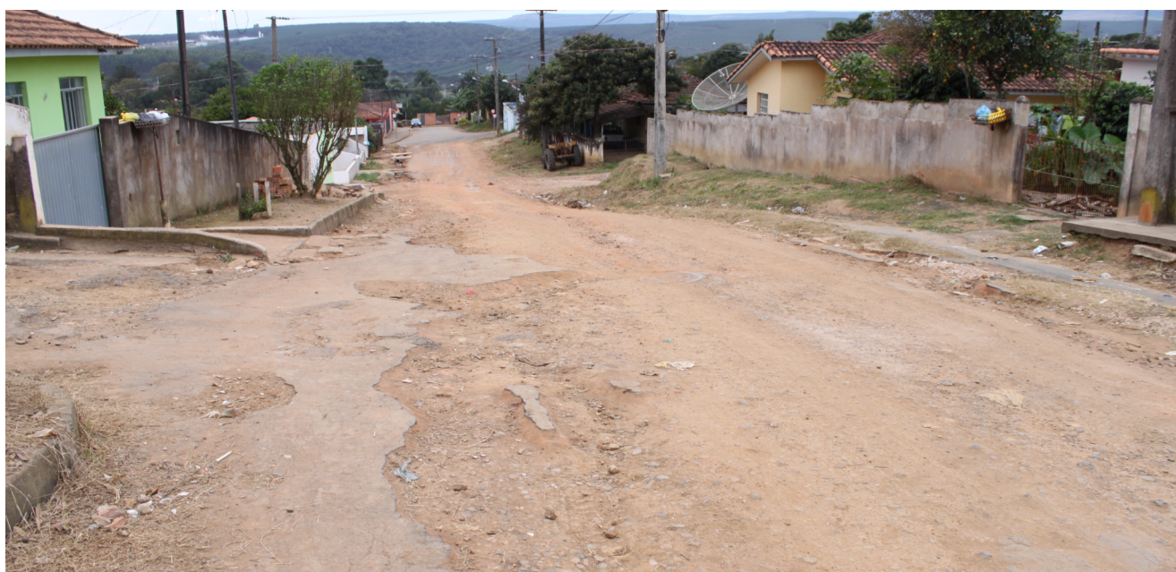
Situação atual da Rua Emílio de Menezes